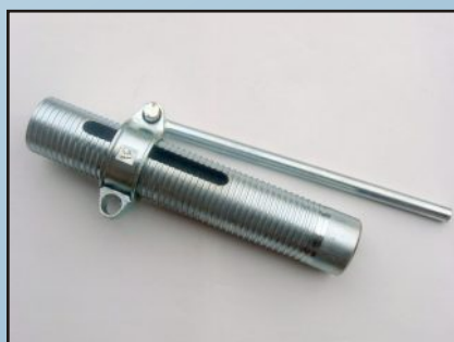
Тръба с резба и гайка с лост за телескопични подпори