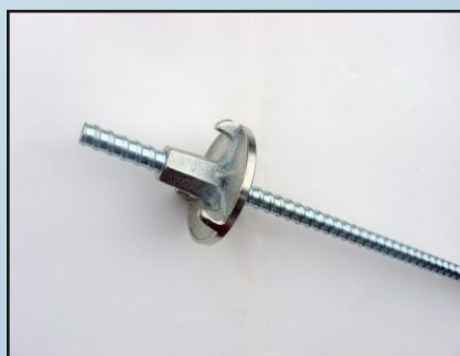
Шпилка и гайка кофражна