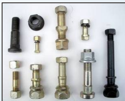
Болтове барабани за товарни автомобили