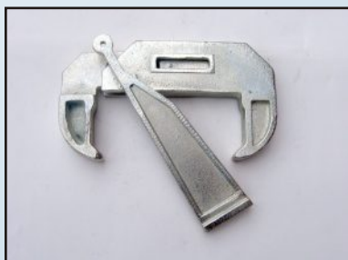
Стега за кофражни платна