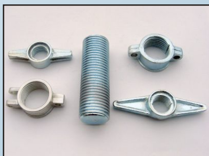
Гайки за фасадно скеле и телескопични подпори