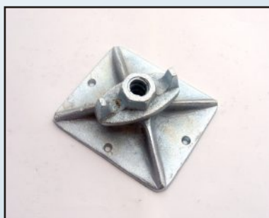
Гайка кофражна с въртяща планка