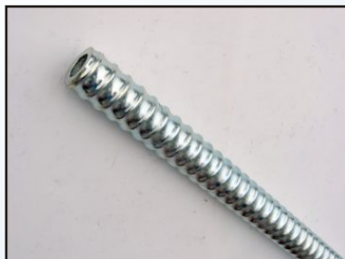
Тръби с резба за укрепване на тунели, пътища и свлачища