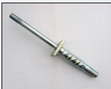
Държач на изолатор за електропреносна мрежа