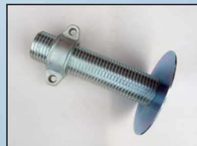
Винт за повдигане на пакет от плочи в строителството