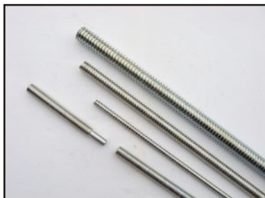
Шпилки с метрична резба и с профил на резбата по желание на клиента