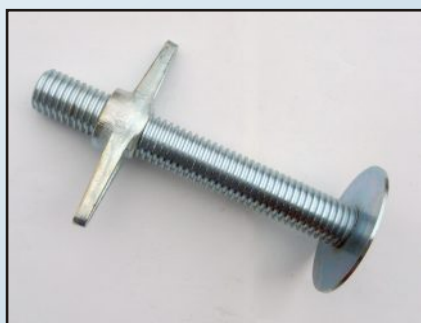
Крик за фасадно скеле