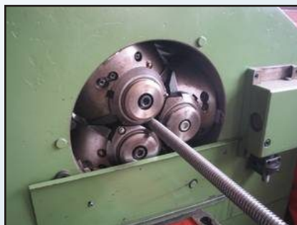
Непрекъснато валцовани резби