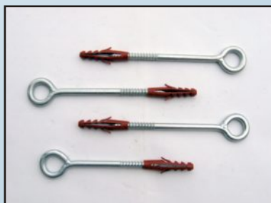
Винт-кука и дюбел за фасадно скеле