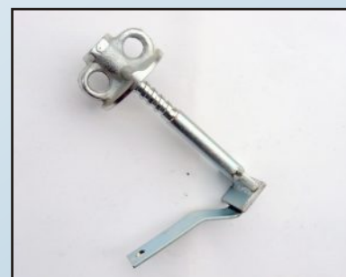
Болт специален кофражен