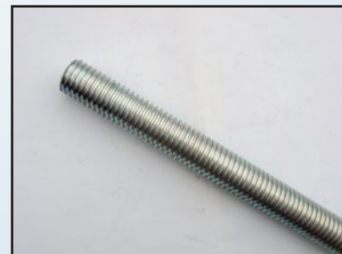
Шпилки с трапецовидна резба